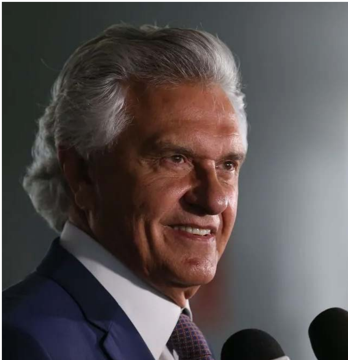
Ronaldo Caiado: carreira política vitoriosa, aprovado como gestor, novas ideias para o país

Caiado tem também uma relação honesta e de alteridade