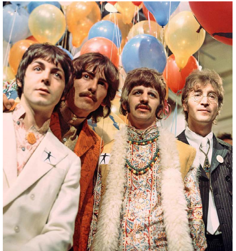
‘Sgt Pepper's Lonely Hearts Club Band’: banda é clicada em 67, ano em que disco saiu