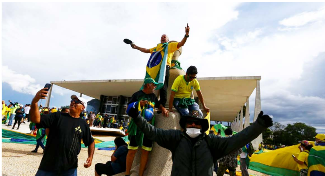
Polícia Federal investiga financiadores dos atos de vandalismo de 8 de janeiro