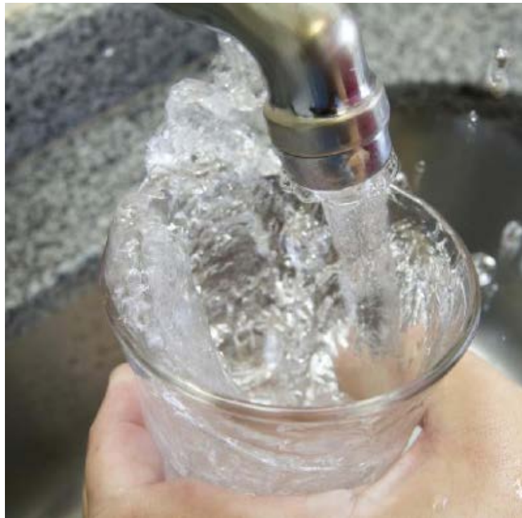
Consumo de água com grandes concentrações de agrotóxicos aumenta o risco de doenças

O alerta máximo aconteceu em 28 municípios brasileiros pesquisados, entre eles Aruanã em Goiás