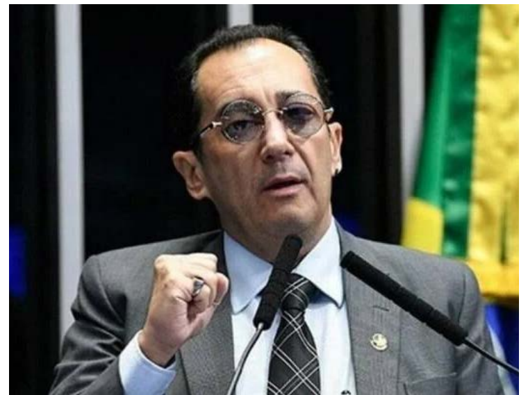
Gustavo Gayer: envolvido em nova polêmica