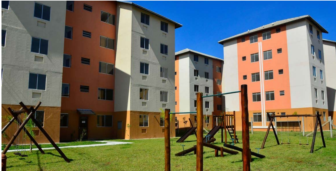
Imóveis são dados como garantia de empréstimo até o pagamento integral das parcelas