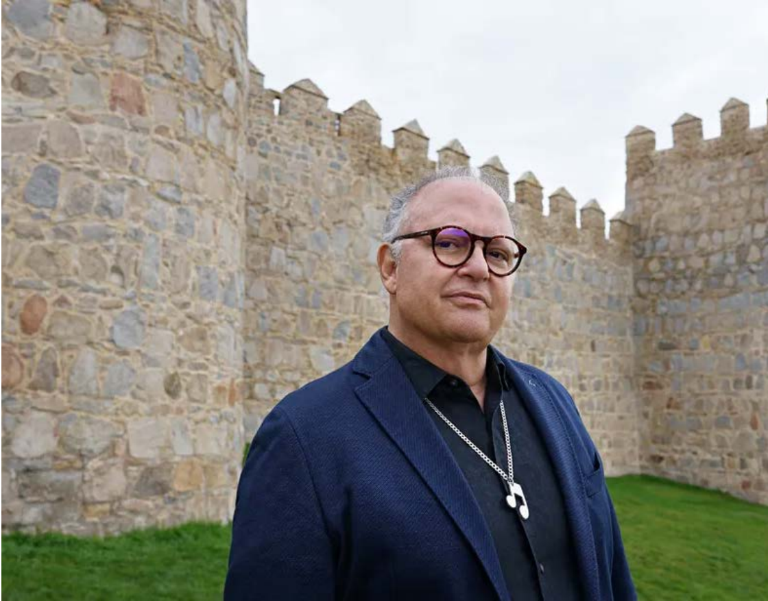
Música ibérica: instrumentista volta a flertar com complexidade harmônica comum ao rock progressivo