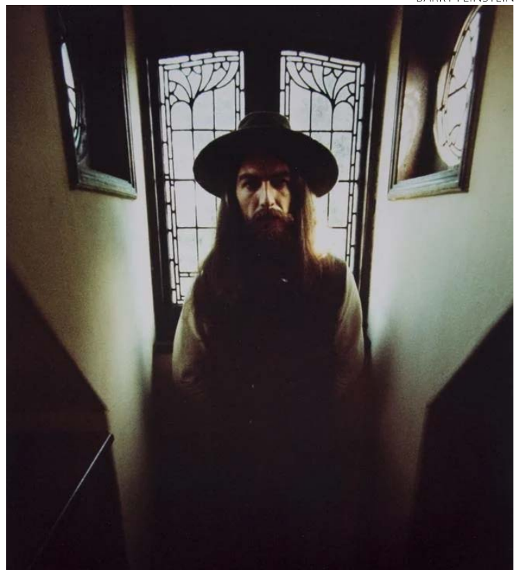
‘Beatle quieto’: invasor desferiu 40 golpes no músico