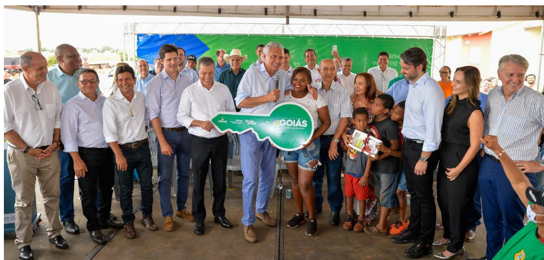
Ronaldo Caiado ressaltou, durante solenidade de entrega das moradias, parcerias firmadas com as prefeituras, que cedem os terrenos

Caiado fez questão de ressaltar que o trabalho na iniciativa ocorre em parceria com as prefeituras, que cedem o terreno para as construções. “É uma realização ímpar. O que estamos fazendo em tantos municípios é levar alegria, dignidade para