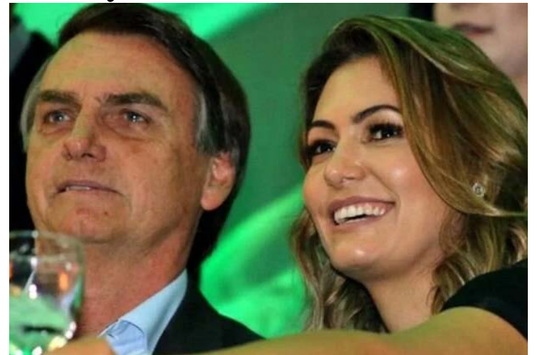
Jair e Michelle Bolsonaro: reforço à pré-campanha do PL em Goiás