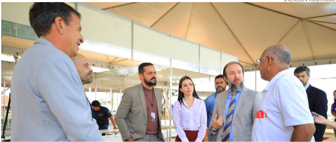
Prefeito Rogério se reúne com representantes de cartórios de Goiânia

“Queremos agradecer o apoio de vocês, acho que é importante as parcerias com o poder público. Nós costumamos dizer que não fazemos nada sozinhos, são quatro mãos, cinco, seis, dez mãos, para atendermos a população, e acho que aqui é um momento que nós podemos mostrar essa capacidade de unidade, com o poder público perto das pessoas”, pontuou o prefeito Rogério.