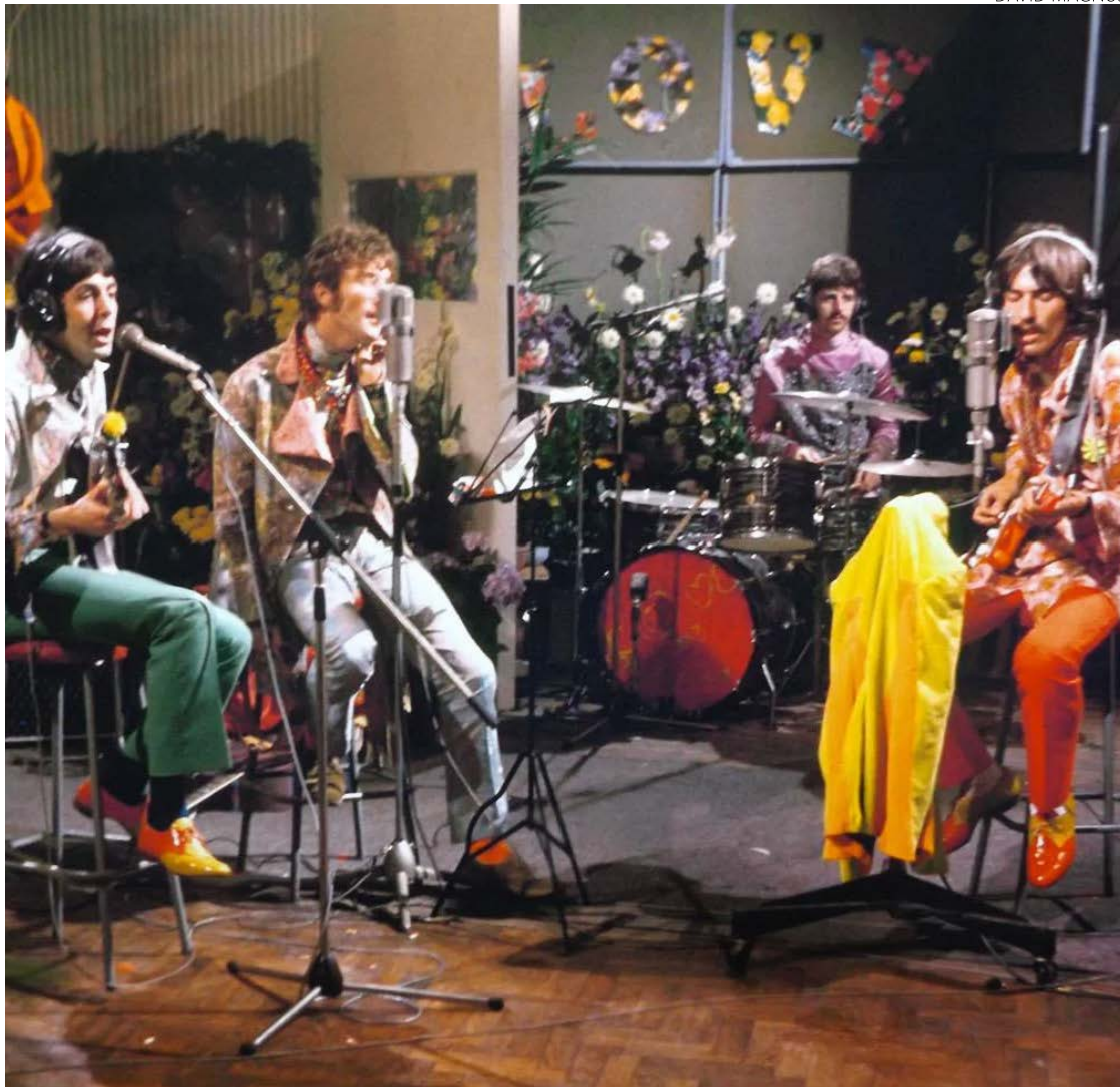
A postos: Paul, John, Ringo e George ensaiam no estúdio Abbey Road, em Londres, no ano de 1967